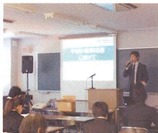
校内企業セミナー