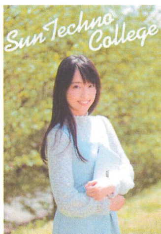
学校パンフレット

前頁で紹介した「キッズプログラミング教室」のチラシです。甲斐市の全小学校5・6年生に配布しました。次回は、春休みの開催を予定しています。小学校5・6年生のお子さんがある同窓会員のの方は、ぜひ、お子さんと一緒に参加してみませんか？