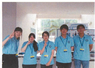
オープンキャンパスで お手伝いして頂いた学生