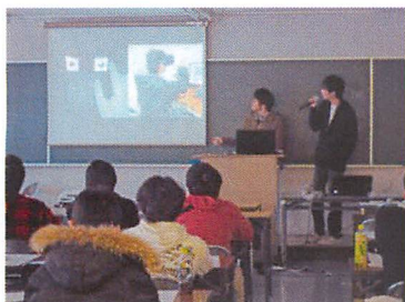
プロジェクト発表会