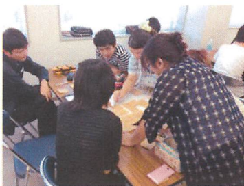
集中講座 「アニメーションアート概論」