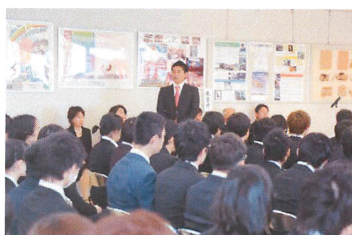
浅原会長にご列席いただきました